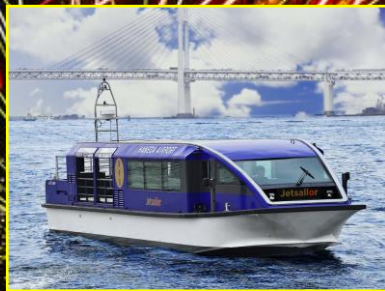
【利用予定船籍】ジェットセイラー号