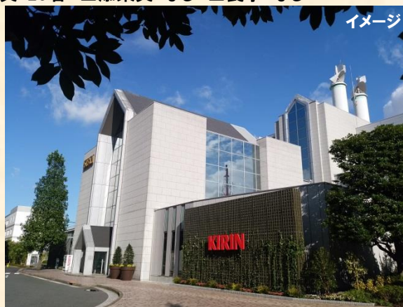
いま話題の「キリンビール横浜工場」