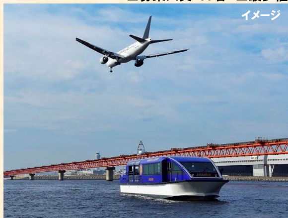
大迫力の「アンダージェットクルーズ」