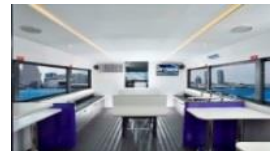
【利用船舶】 Jetsailor 船内(イメージ) 【運航】株式会社ケーエムシーコーポレーション